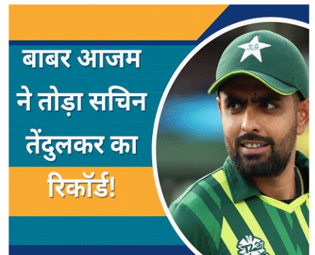
बाबर आजम ने तोड़ा सचिन तेंदुलकर का रिकॉर्ड!

(C) पाकिस्तानी क्रिकेट टीम के कप्तान बाबर आजम अंतर्राष्ट्रीय क्रिकेट में पारियों के हिसाब से 12000 रन बनाने वाले दूसरे सबसे तेज एशियाई बल्लेबाज बन गए। उन्होंने यह मुकाम 277 पारियां खेल कर हासिल की। अंतर्राष्ट्रीय क्रिकेट में सबसे तेज 12000 रन बनाने का एशियाई रिकॉर्ड भारत के स्टार बल्लेबाज विराट कोहली के नाम है।