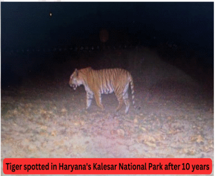
Tiger spotted in Haryana's Kalesar National Park after 10 years