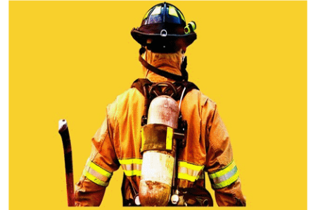
International Firefighters' Day

(C) हर साल 4 मई को विश्व स्तर पर अंतर्राष्ट्रीय अग्निशमन दिवस मनाया जाता है। इस दिन को वर्ष अग्निशमकों के बलिदानों को चिन्हित और उन्हें सम्मानित करने के लिए मनाया जाता है जो समुदाय और पर्यावरण को सुरक्षित रखने के यथासंभव प्रयास करते हैं। इसका मुख्य उद्देश्य फायर फाइटरों को सम्मान और धन्यवाद देना है, जो अपनी जान दांव पर लगाकर लोगों और वन्य जीवों की जान आग से बचाते हैं।