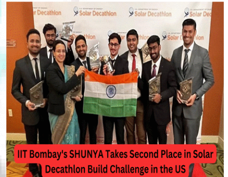
IIT Bombay's SHUNYA Takes Second Place in Solar Decathlon Build Challenge in the US

(B) भारतीय प्रौद्योगिकी संस्थान बॉम्बे की शुन्या टीम ने सोलर डेकाथॉन बिल्ड चैलेंज में दूसरी पोजीशन हासिल की है। उन्होंने मुंबई के गर्म और आर्द्र जलवायु में होने वाले वायु प्रदूषण समस्याओं का समाधान करने के लिए शून्य ऊर्जा वाले घर का डिजाइन किया। शुन्या एक आईआईटी बॉम्बे के छात्रों का समूह है जो एक टिकाऊ भविष्य बनाने के लिए प्रतिबद्ध है।